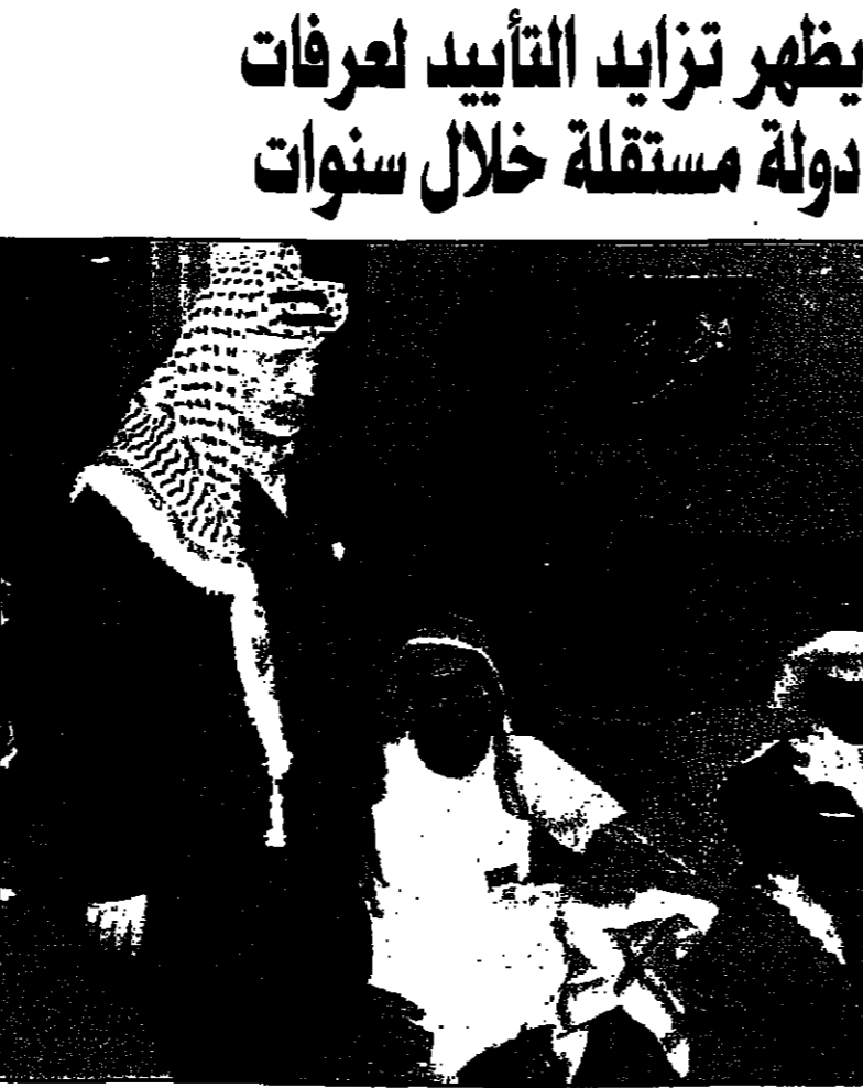
عرصات يعان تامة للوزارات في طهران امس

قلت اسرائيل امس الخميس انها لا تستطيع التمسك بالوفاء بمهلة وزيرة الخارجية الامريكية لانسحاب 13 في المئة من الضفة الغربية.